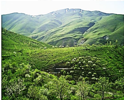
پارک جنگلی آبیدر شهر سنندج