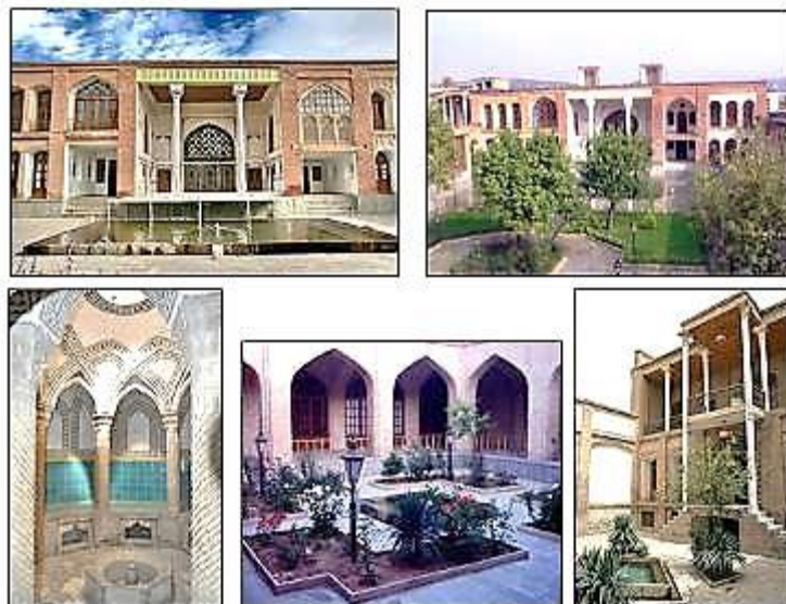
شکل ۲. تصاویری از عمارت آصف دیوان

صفویه است که در دوره‌های بعدی، به‌ویژه در دوران قاجار و پهلوی، به‌تدریج بخش‌هایی به آن افزوده شده است (طرح جامع گردشگری استان کردستان ۱۳۸۴). در شکل ۲ تصاویری از کالبد و فضاهای جانبی عمارت نشان داده شده است.