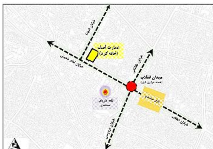
شکل ۱. موقعیت خانه کرد در هسته مرکزی شهر سندج

سندج مرکز استان فرهنگی کردستان با جذابیت‌های گردشگری ارزشمند و بی‌شمار، در سال ۱۰۴۶ق در زمان حکومت سلسله صفویه و در دوران شاه‌صفی و به دست سلیمان‌خان اردلان بنا نهاده شد. نام سندج معرب «سنه دژ» است که هم‌اکنون نیز مردم مناطق کردنشین سندج را سنه می‌نامند. «سنه» در فرهنگ لغات اوستایی به معنای شاهین و عقاب است؛ هرچند درباره‌ی واژه سنه تعاریف دیگری نیز وجود دارد. سندج به علت مرکزیت در گذشته، مساجد، ابنیه و عمارات، و بازار قدیمی دارد، که هم‌اکنون بیشترین تعداد جاذبه‌های این شهر را تشکیل می‌دهد. خانه کرد اکنون به‌عنوان موزه مردم‌شناسی در ضلع شمالی خیابان امام خمینی شهر سندج فعالیت می‌کند (شکل ۱). این عمارت یکی از عمارت‌های بزرگ اعیانی شهر سندج است که ارزش‌های ویژه معماری از لحاظ آجرکاری و گچ‌بری و الگوهای ارسی‌سازی دارد که در نوع خود منحصر به فرد است.