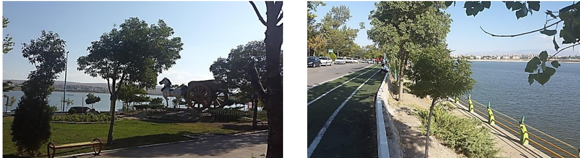
شکل شماره ۲: تصاویری از تفرجگاه شورابیل

ماهیان، دوزیستان، خزندگان و پرندگان است. از میان ماهیان، ماهی سیاه، سس ماهی، کاراس و قزل آلاهی رنگین کمان را می‌توان نام برد. پرندگان مهاجر آبی و کنارآبی، از مهم‌ترین گونه‌های جانوری این تالاب محسوب می‌شوند. از جمله این پرندگان می‌توان به گونه‌هایی مانند حواصیل، کاکایی، مرغابی، غاز خاکستری، آنقوت، پرستوی دریایی، فلامینگو و... اشاره کرد (سازمان حفاظت محیط زیست اردبیل، ۱۳۸۱: ۸-۱۰).