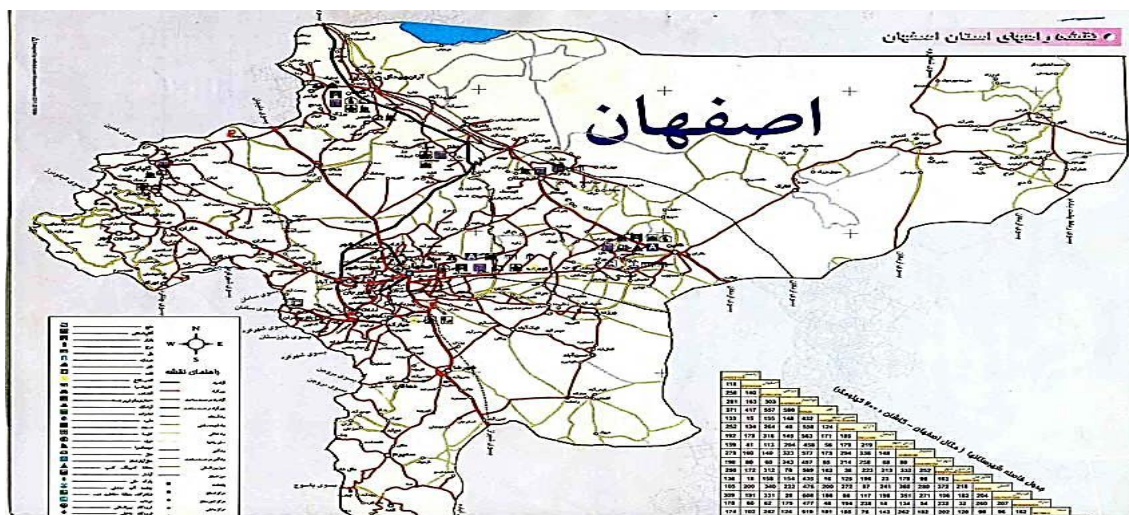
شکل ۲. موقعیت جغرافیایی منطقه مورد مطالعه

درجه و ۲۷ دقیقه عرض شمالی و ۴۹ درجه و ۳۸ دقیقه تا ۵۵ درجه و ۳۲ دقیقه طول شرقی در بخش مرکزی ایران در جلگه‌ای حاصلخیز و پربرکت واقع شده است که به‌طور خلاصه می‌توان گفت بیشتر شهرها و روستاهای آن حاصل جریان زاینده‌رود است. شکل استان از لحاظ گسترش در امتداد طول و عرض جغرافیایی به‌گونه‌ای است که میانگین طول آن ۵۳۲/۵ کیلومتر و عرض آن برابر با ۴۰۵ کیلومتر است. استان اصفهان از شمال به استان‌های مرکزی، قم و سمنان، از جنوب به استان‌های فارس و کهگیلویه و بویراحمد، از شرق به استان‌های یزد و خراسان و از غرب به استان‌های لرستان و چهارمحال و بختیاری محدود می‌شود. براساس آخرین تقسیمات کشوری در سال ۱۳۹۰، استان اصفهان ۲۳ شهرستان، ۴۵ بخش، ۱۰۳ شهر و ۱۲۵ دهستان دارد. جمعیت استان اصفهان طبق نتایج سرشماری نفوس و مسکن در سال ۱۳۹۵، برابر ۵۱۲۰۸۵۰ نفر، شامل ۲۵۹۹۴۷۷ نفر مرد و ۲۵۲۱۳۷۳ نفر زن بوده است که در ۱۶۰۷۴۸۲ خانوار زندگی می‌کنند (اداره کل میراث فرهنگی، صنایع‌دستی و گردشگری استان اصفهان، ۱۳۹۵).