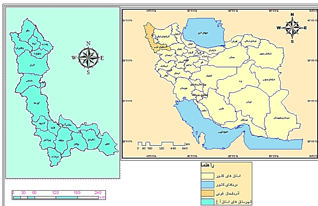
شکل ۱. محدوده مورد مطالعه

ارزشمند گذشتگان است، غار شگفت‌انگیز سهولانش (مهاباد) چشم هر بیننده‌ای را به اشک می‌نشانند و طبیعت رؤیایی آن، مخلوق را به تحسین خالق برمی‌انگیزاند. این استان یکی از خوش آب‌وهواترین استان‌های کشور است و هوای آن نه گرم و شرجی و نه مرطوب و در بیشتر اوقات سال هوای معتدل کوهستانی دارد. پیشینه تاریخی و سابقه کهن فرهنگی استان، سبب وجود جاذبه‌های تاریخی، جاذبه‌های اجتماعی و فرهنگی بسیاری در منطقه شده است. مکان‌های تاریخی و مذهبی موجود در استان، گویای بخشی از تاریخ مذهبی این منطقه است. مسجد جامع ارومیه از مسجدهای قدیمی استان به‌شمار می‌آید. کلیساهای قدیمی زیادی نیز در سطح استان وجود دارند که از جاذبه‌های دیدنی آن به‌شمار می‌آیند (خضر سوری و دیگران، ۱۳۹۲: ۱). شکل ۱ محدوده مورد مطالعه تحقیق را نشان می‌دهد.