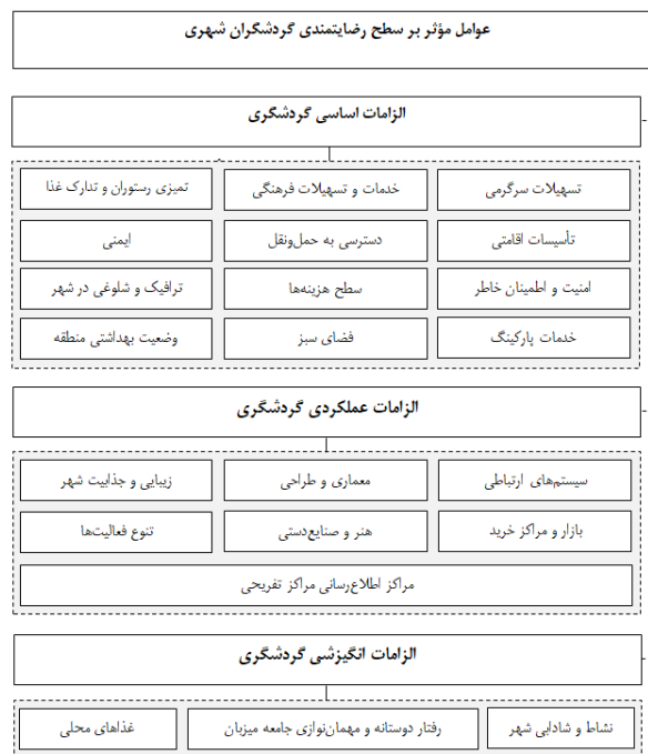
شکل شماره ۱. عوامل مؤثر بر سطح رضایتمندی گردشگران شهری